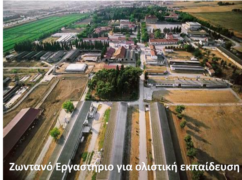
Ζωντανό Εργαστήριο για ολιστική εκπαίδευση